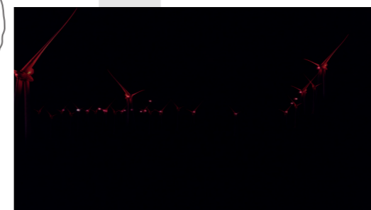
Les éoliennes dans le paysage nocturne du sud du Pays de Châlons