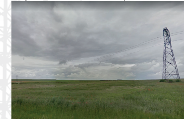
Les lignes très haute tension à travers champs

« C'est très strict avec toutes ces lignes dans le paysage, les fils, les champs ... »