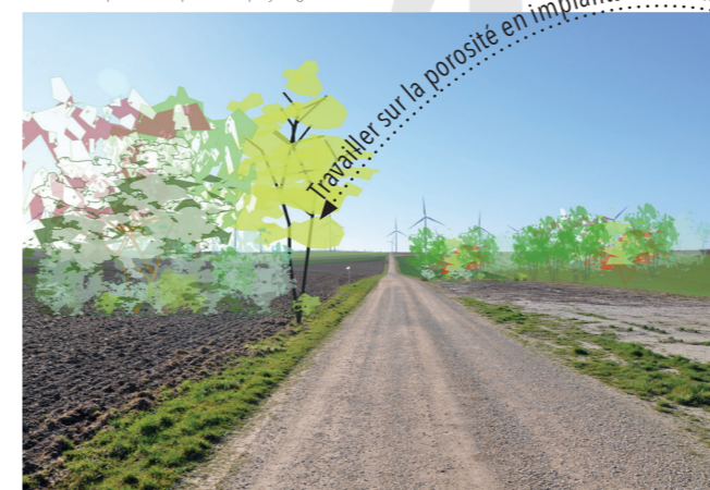
Coupetz, février 2020

« Papa, c'est des guirlandes de Noël dans le ciel ? »