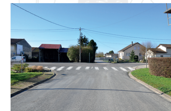
Lignes électriques au milieu des villages