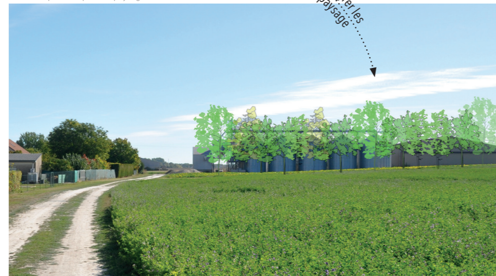
Courtisols, septembre 2020